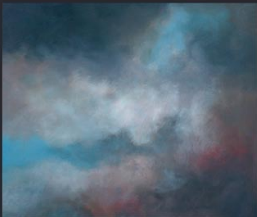
„Cloud Nr. 17“ polychrome Lasurmalerei auf Papier (200 Gr.), Acryl finished mit Lascaux (UV Filter) 110x93 cm, kaschiert auf PVC, 2009