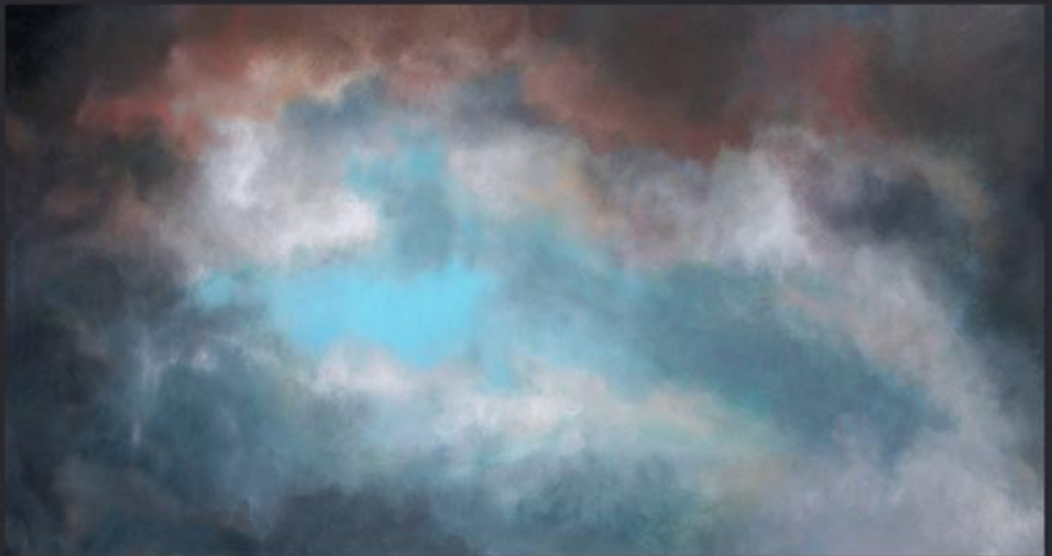
„Cloud Nr. 05“ polychrome Lasurmalerei auf Papier (200 Gr.), Acryl finished mit Lascaux (UV Filter) 225x120 cm, kaschiert auf PVC, 2009