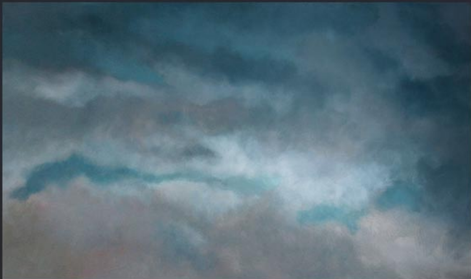
„Cloud Nr. 11“ polychrome Lasurmalerei auf Papier (200 Gr.), Acryl finished mit Lascaux (UV Filter) 203x120 cm, kaschiert auf PVC, 2009