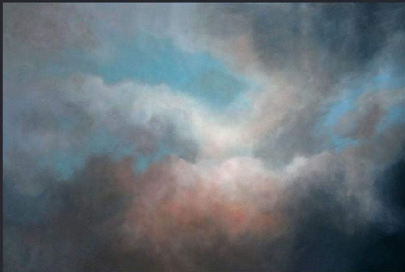
„Cloud Nr. 03“ polychrome Lasurmalerei auf Papier (200 Gr.), Acryl finished mit Lascaux (UV Filter) 178x120 cm, kaschiert auf PVC, 2009