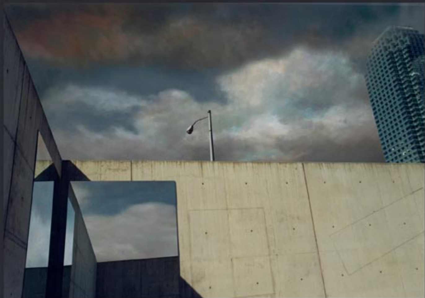
„Heading PS 1...“, 100x70 cm, series of 3, Lambda print mounted on Dipond (analog / digitalisiert) coated with clear foil / 2010