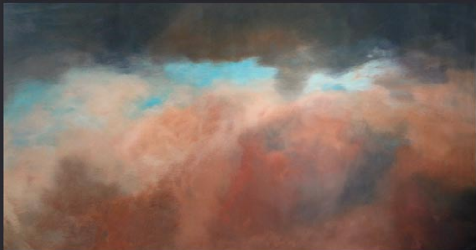
„Cloud Nr. 07“ polychrome Lasurmalerei auf Papier (200 Gr.), Acryl finished mit Lascaux (UV Filter) 225x120 cm, kaschiert auf PVC, 2009