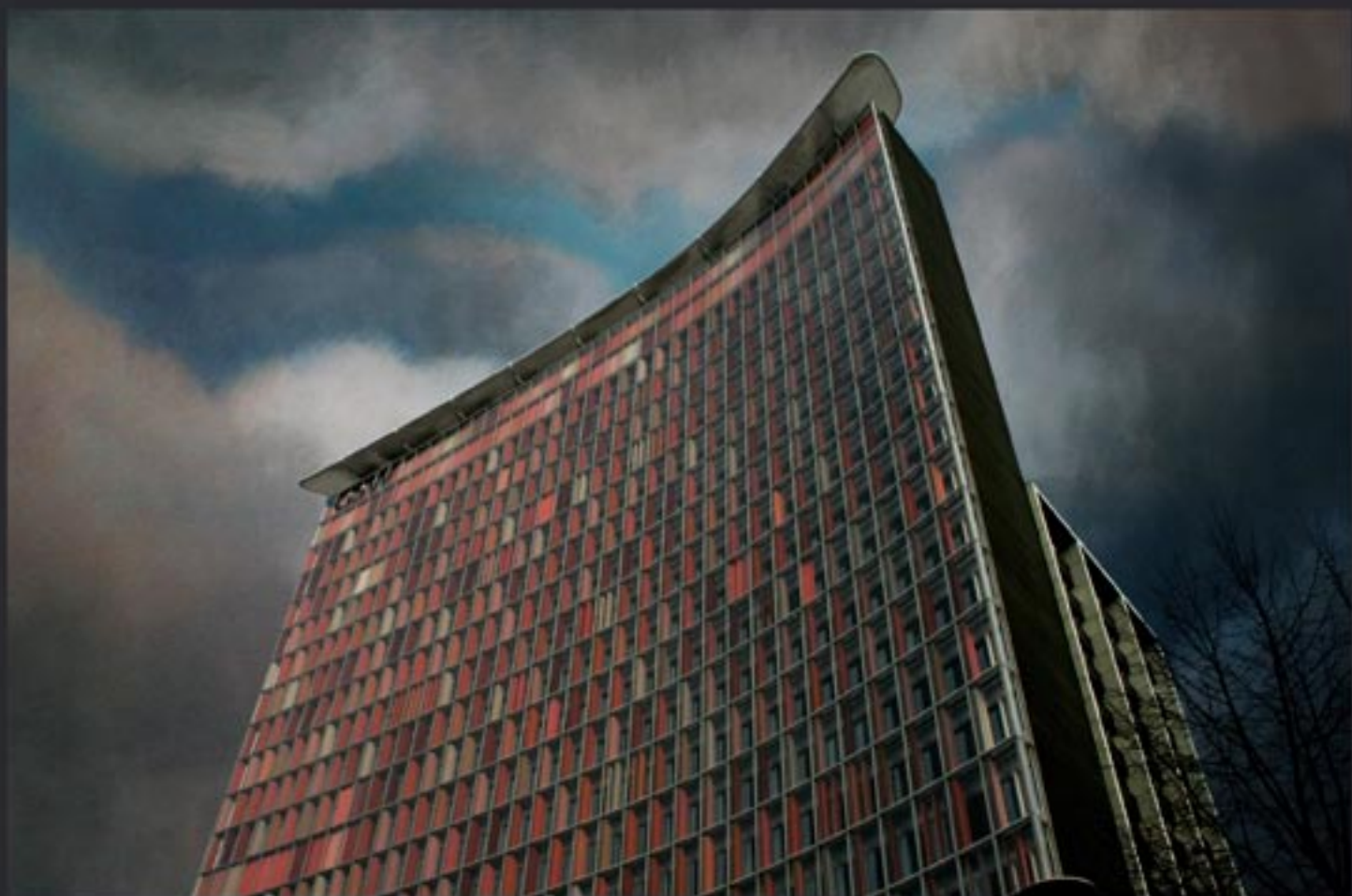
„Heading center...” 150x100 cm, series of 3, Lamda print mounted on Dipond, coated with clear foil / 2010