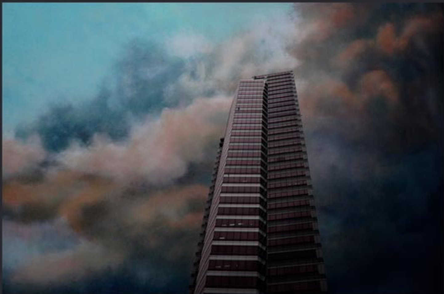
„Heading scraper...” 150x100 cm, series of 3, Lamda print mounted on Dipond, coated with clear foil / 2010