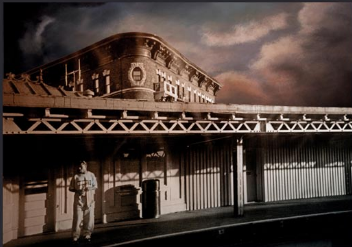
„Heading Bronx...“, 100x70 cm, series of 3, Lambda print mounted on Dipond (analog / digitalisiert) coated with clear foil / 2010