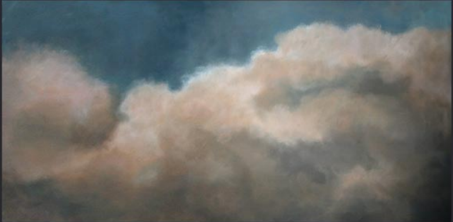
„Cloud Nr. 08“ polychrome Lasurmalerei auf Papier (200 Gr.), Acryl finished mit Lascaux (UV Filter) 230x120 cm, kaschiert auf PVC, 2009