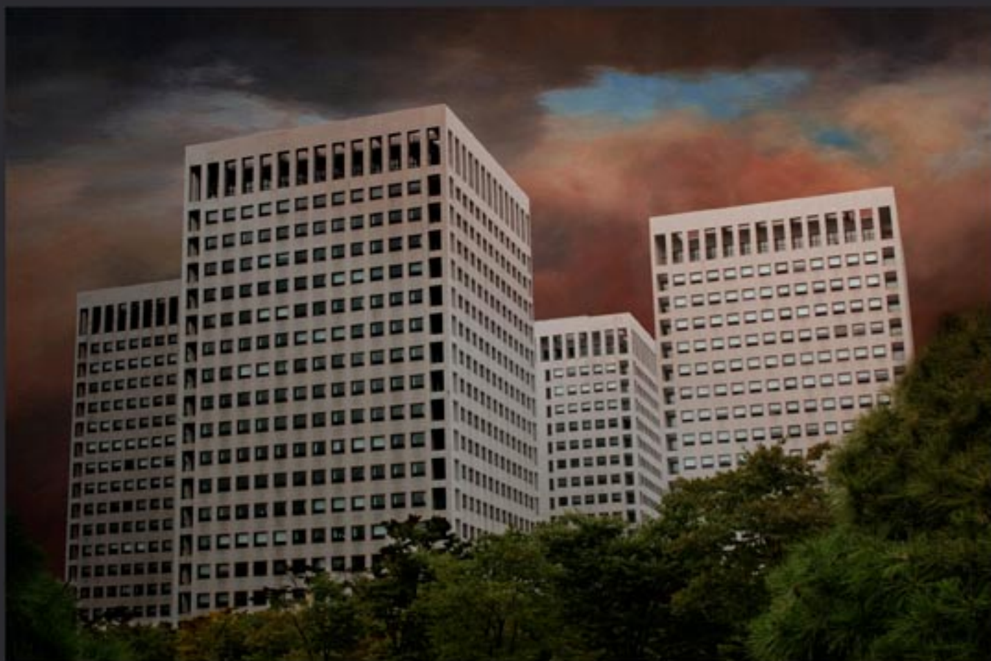
„Heading city council...” 150x100 cm, series of 3, Lamda print mounted on Dipond, coated with clear foil / 2010