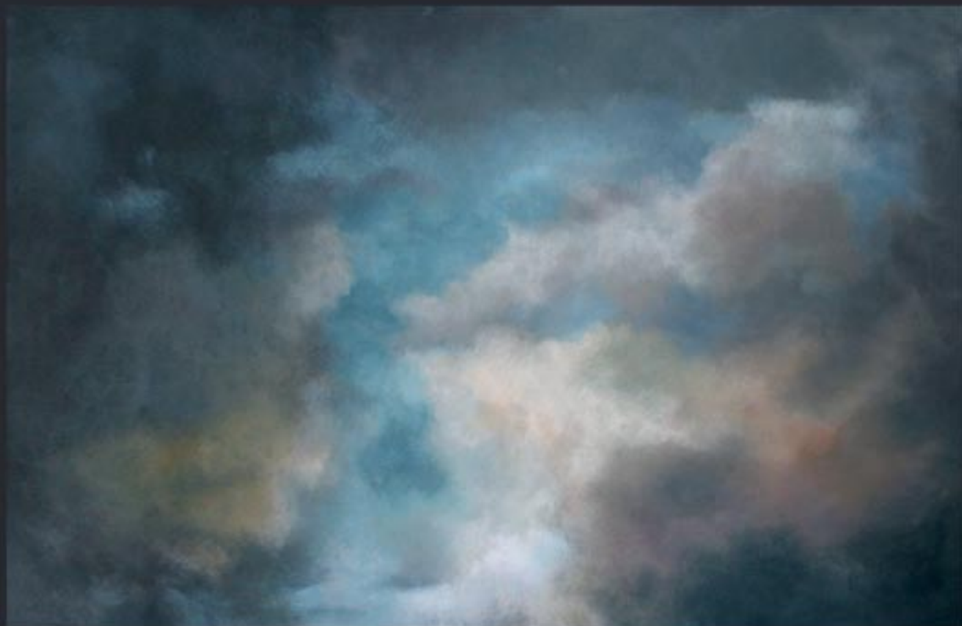
„Cloud Nr. 16“ polychrome Lasurmalerei auf Papier (200 Gr.), Acryl finished mit Lascaux (UV Filter) 185x120 cm, kaschiert auf PVC, 2009