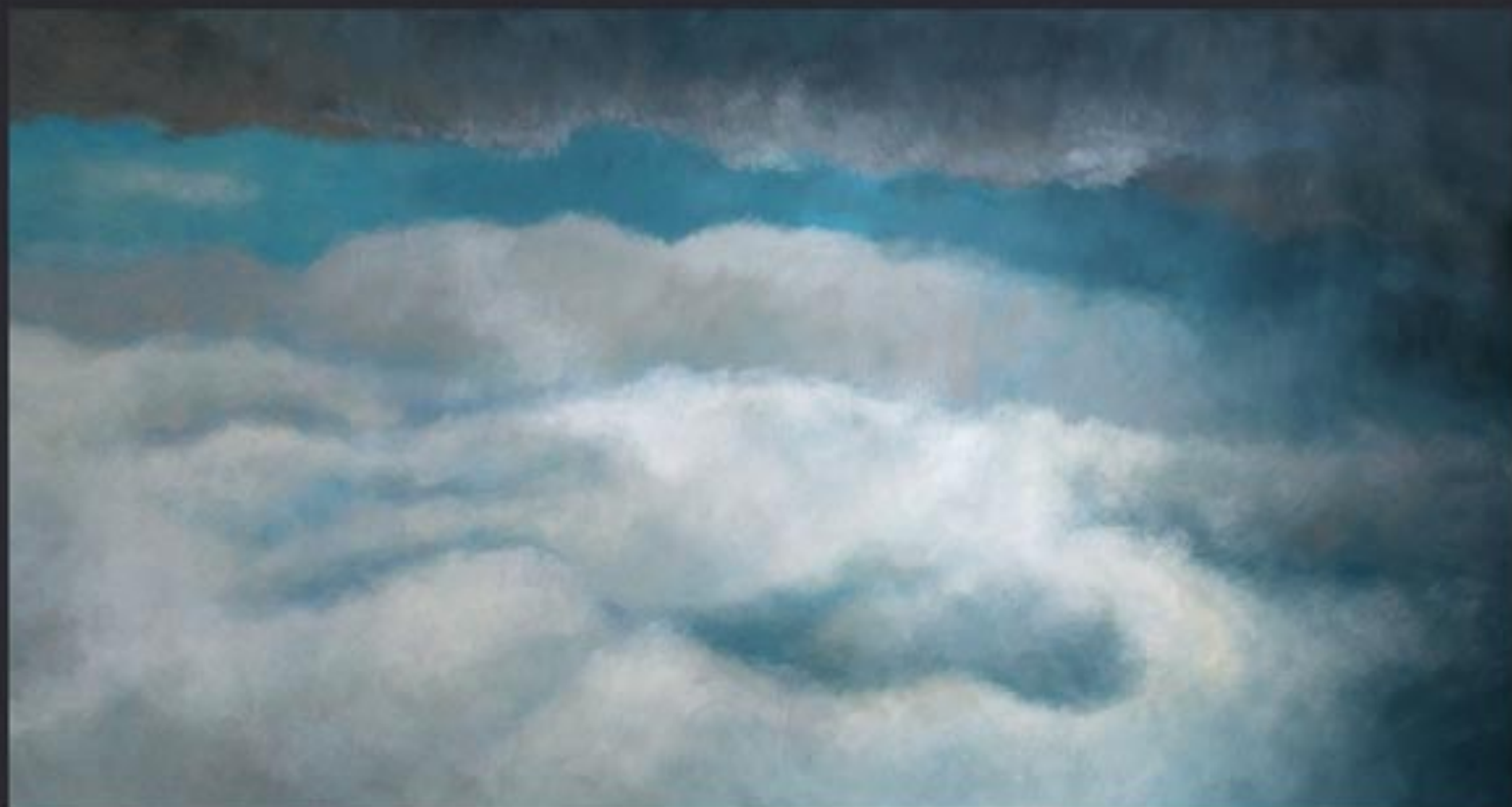
„Cloud Nr. 09“ polychrome Lasurmalerei auf Papier (200 Gr.), Acryl finished mit Lascaux (UV Filter) 220x120 cm, kaschiert auf PVC, 2009