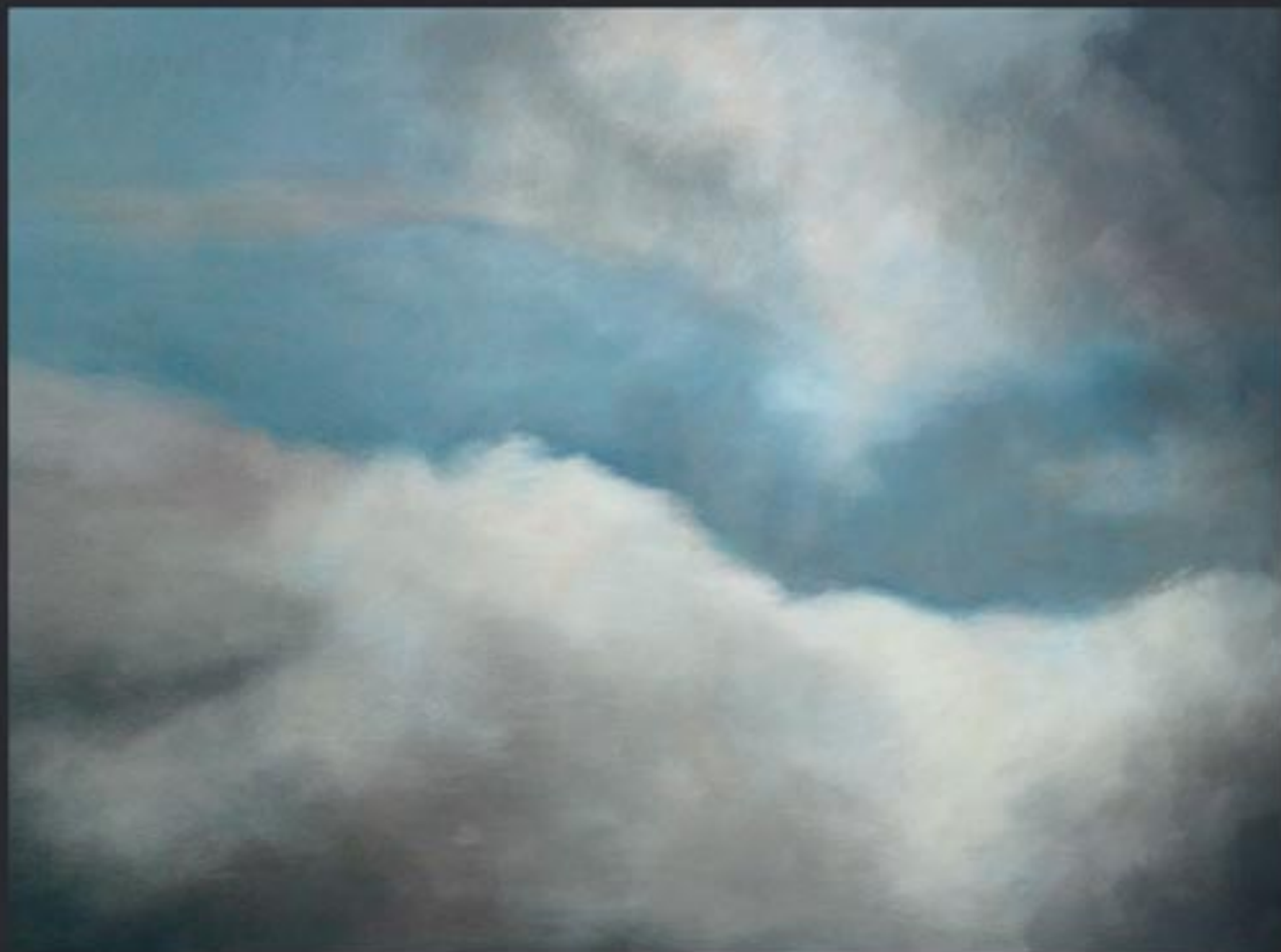
„Cloud Nr. 18“ polychrome Lasurmalerei auf Papier (200 Gr.), Acryl finished mit Lascaux (UV Filter) 175x130 cm, kaschiert auf PVC, 2009