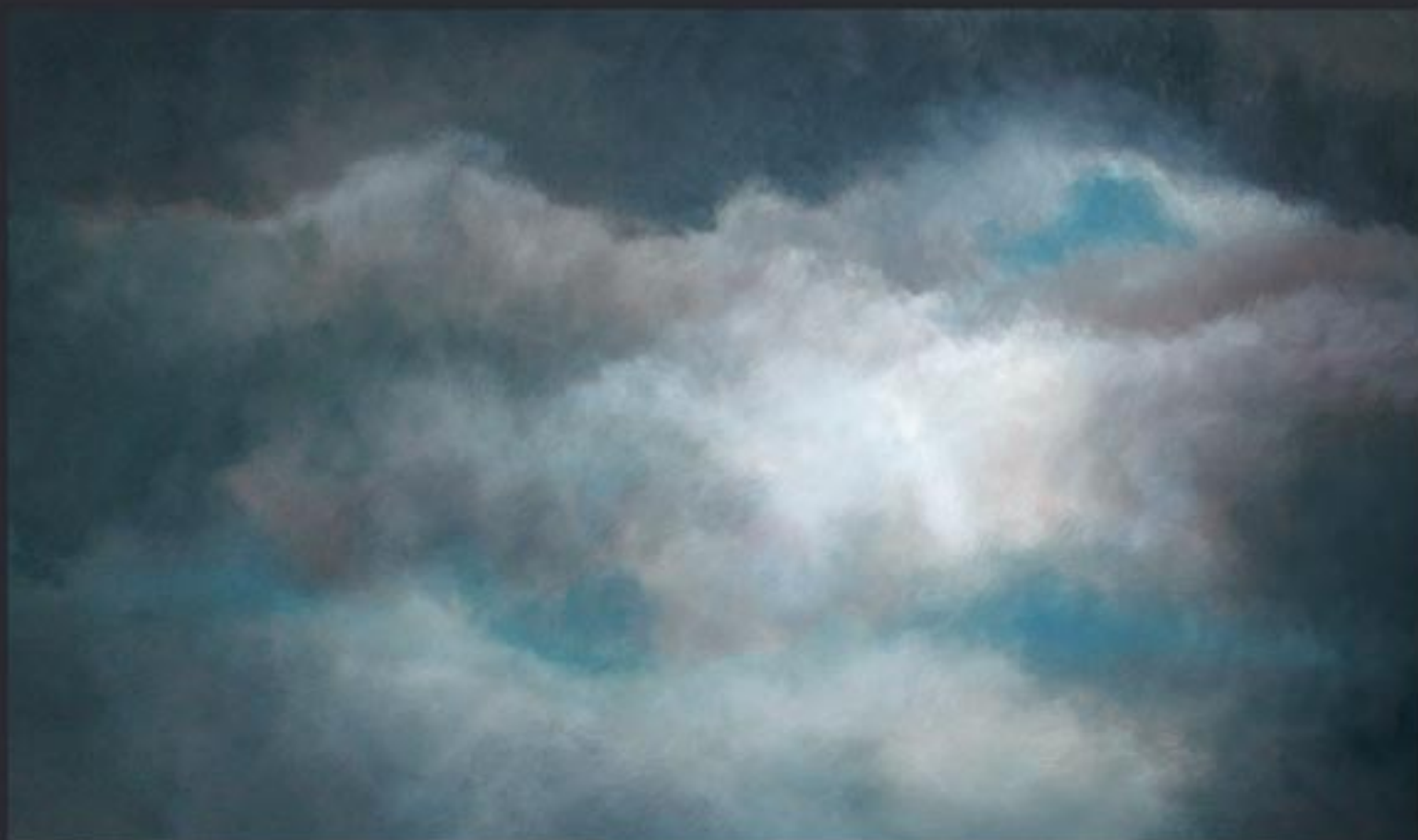
„Cloud Nr. 12“ polychrome Lasurmalerei auf Papier (200 Gr.), Acryl finished mit Lascaux (UV Filter) 205x120 cm, kaschiert auf PVC, 2009