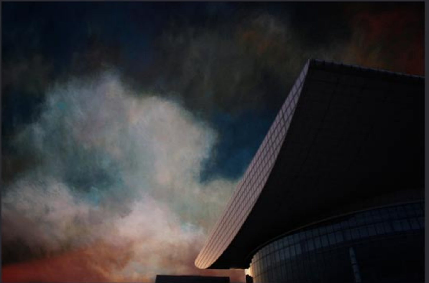
„Heading opera-house...” 150x100 cm, series of 3, Lamda print mounted on Dipond, coated with clear foil / 2010