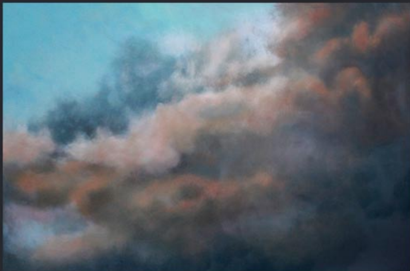
„Cloud Nr. 15“ polychrome Lasurmalerei auf Papier (200 Gr.), Acryl finished mit Lascaux (UV Filter) 180x120 cm, kaschiert auf PVC, 2009