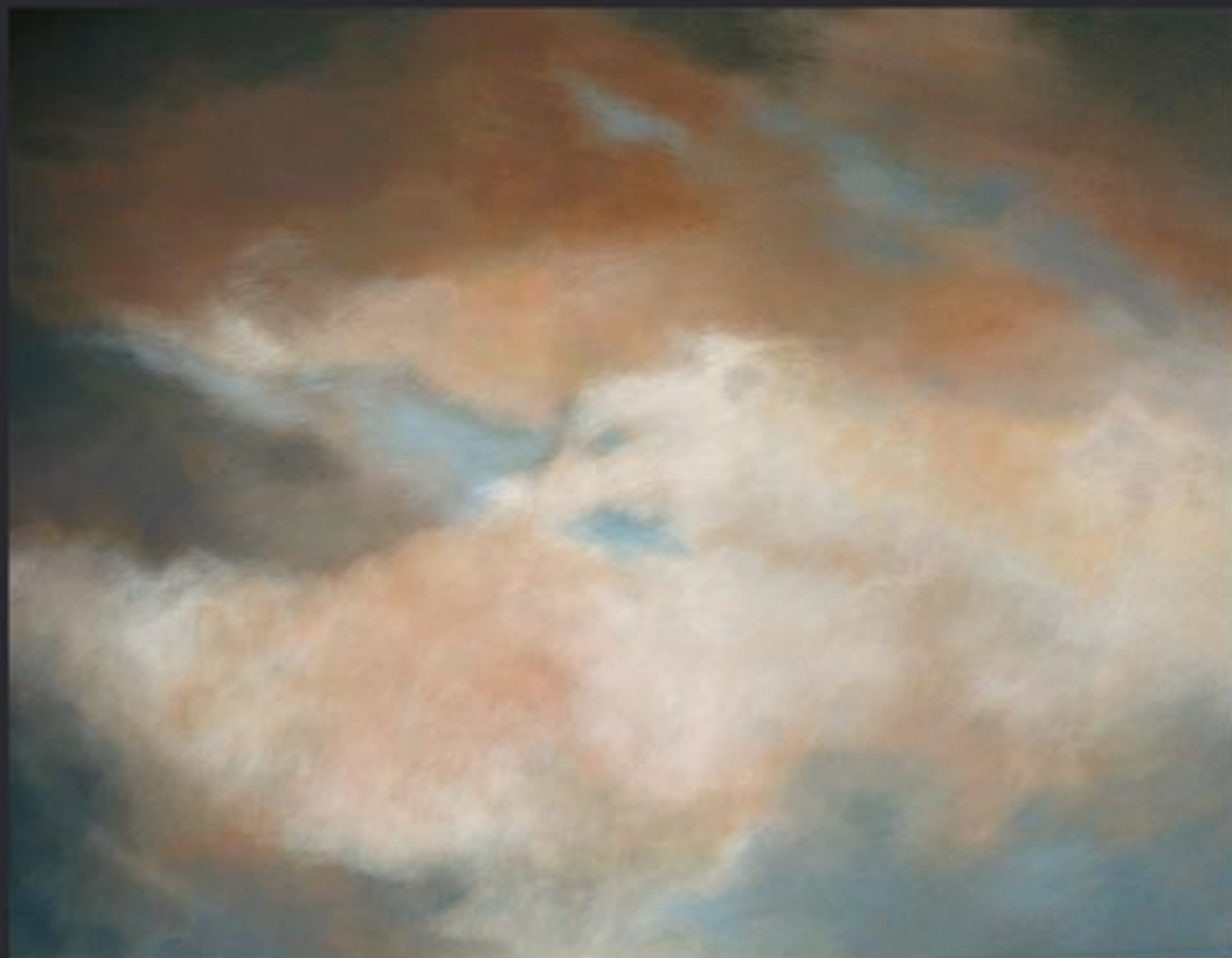
„Cloud Nr. 19“ polychrome Lasurmalerei auf Papier (200 Gr.), Acryl finished mit Lascaux (UV Filter) 170x130 cm, kaschiert auf PVC, 2009