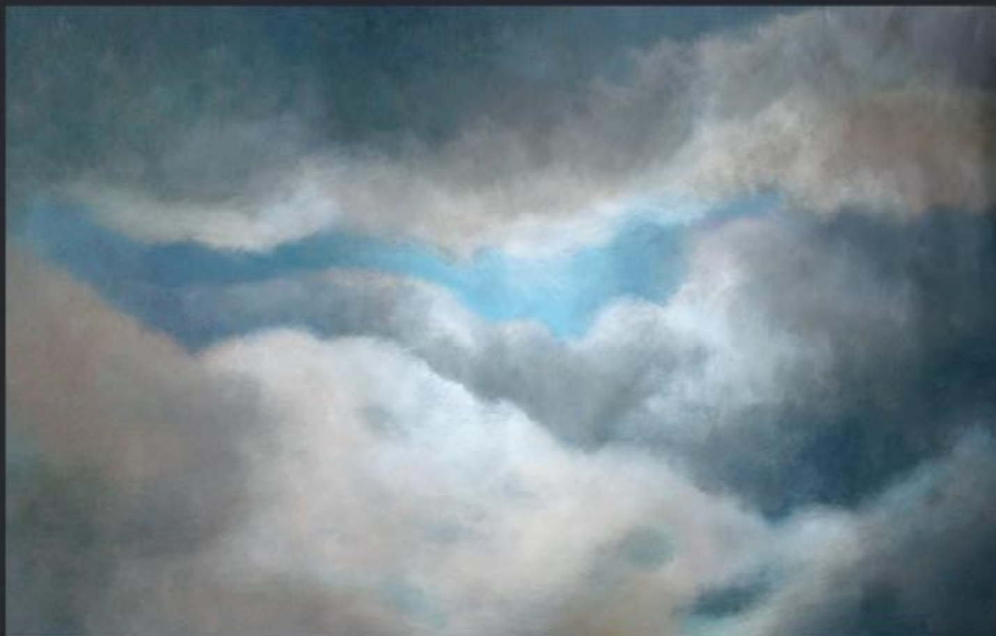
„Cloud Nr. 04“ polychrome Lasurmalerei auf Papier (200 Gr.), Acryl finished mit Lascaux (UV Filter) 180x120 cm, kaschiert auf PVC, 2009