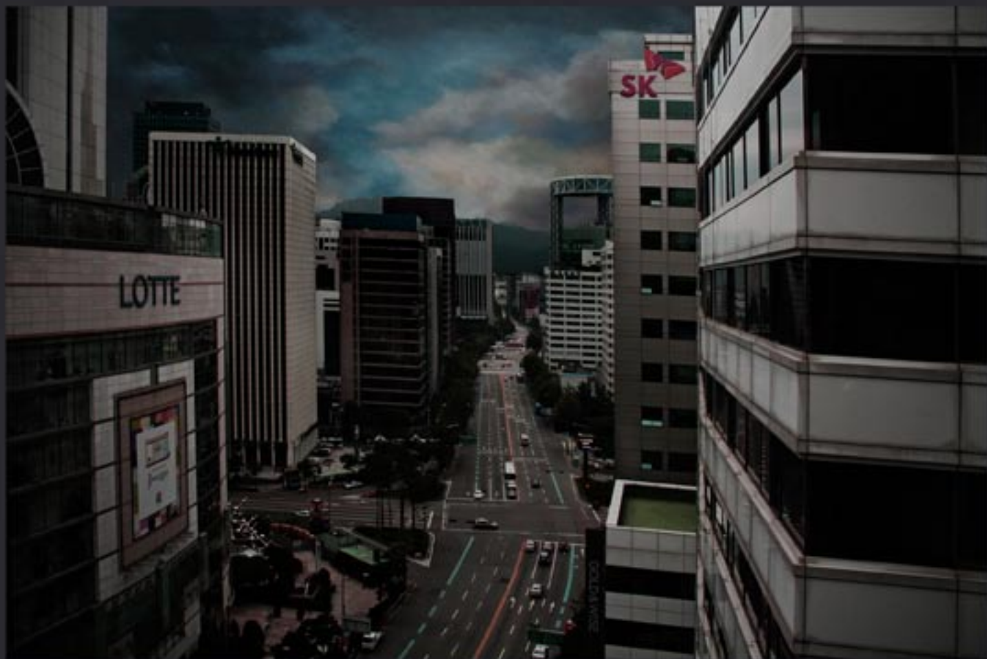
„Heading east...“ 150x100 cm, series of 3, Lamda print mounted on Dipond, coated with clear foil / 2010