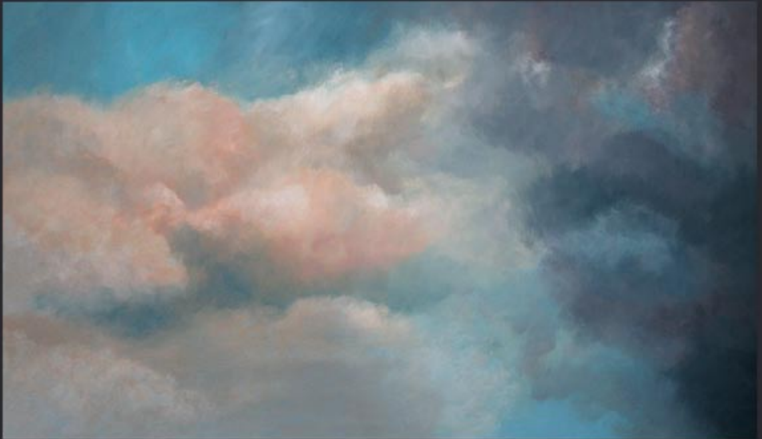
„Cloud Nr. 10“ polychrome Lasurmalerei auf Papier (200 Gr.), Acryl finished mit Lascaux (UV Filter) 210x120 cm, kaschiert auf PVC, 2009