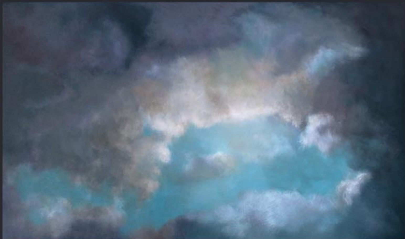
„Cloud Nr. 14“ polychrome Lasurmalerei auf Papier (200 Gr.), Acryl finished mit Lascaux (UV Filter) 203x120 cm, kaschiert auf PVC, 2009