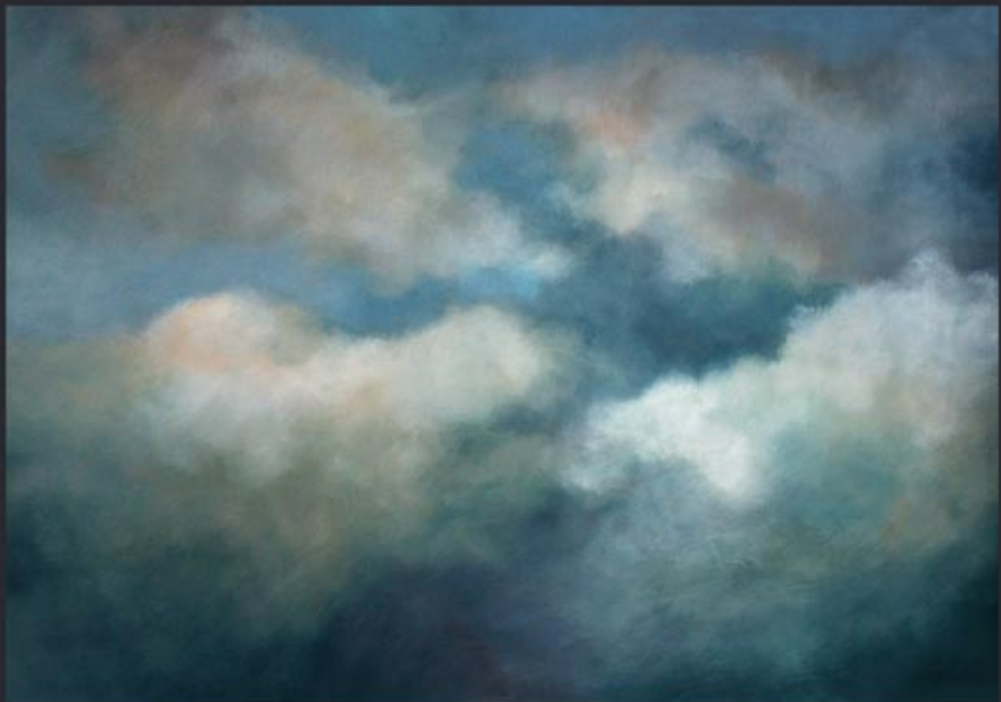
„Cloud Nr. 20“ polychrome Lasurmalerei auf Papier (200 Gr.), Acryl finished mit Lascaux (UV Filter) 185x128 cm, kaschiert auf PVC, 2009