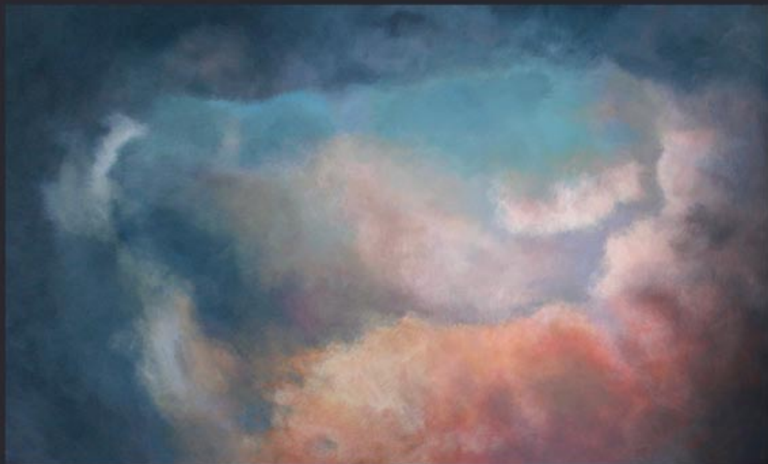
„Cloud Nr. 13“ polychrome Lasurmalerei auf Papier (200 Gr.), Acryl finished mit Lascaux (UV Filter) 198x120 cm, kaschiert auf PVC, 2009