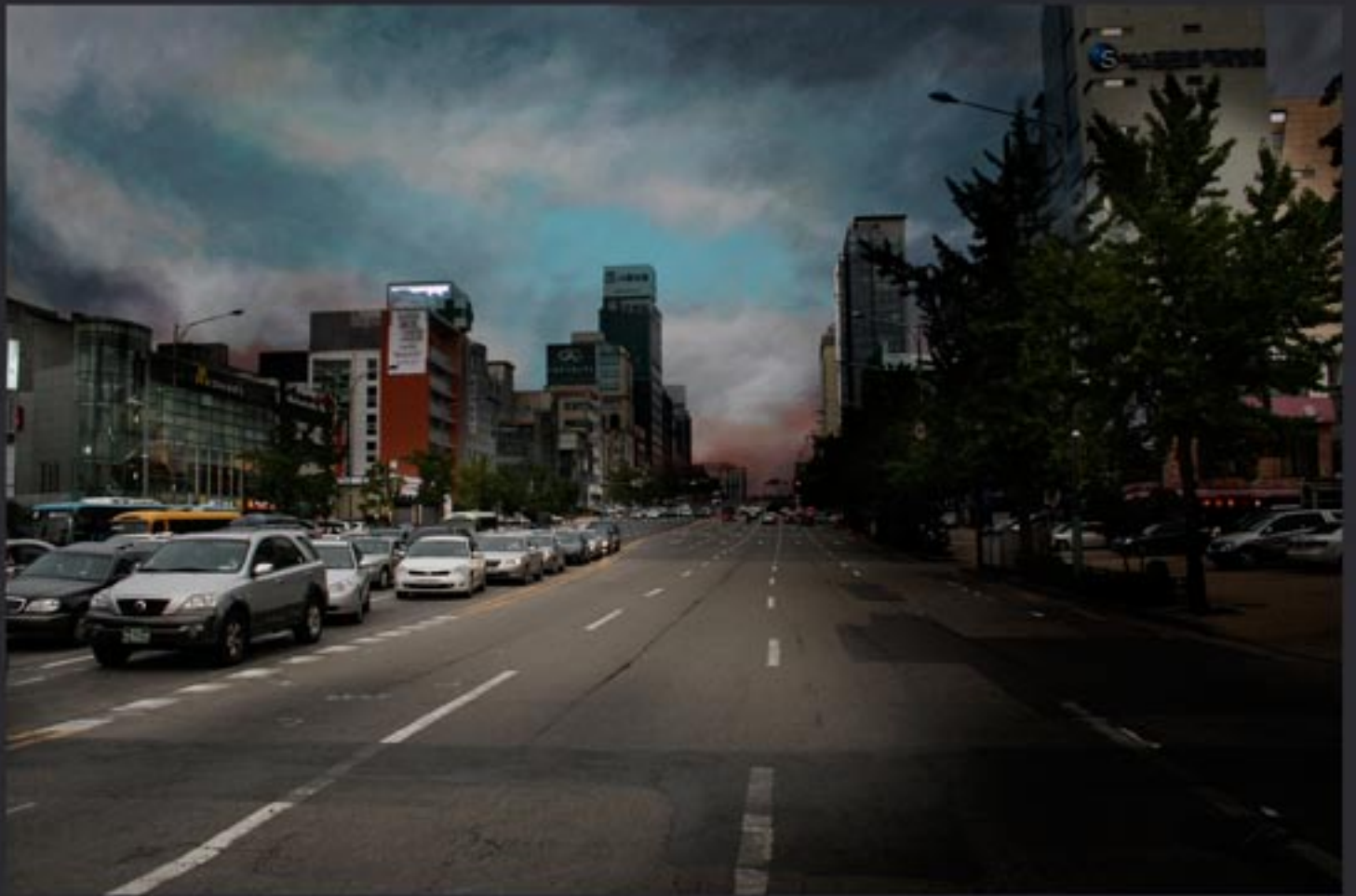
„Heading horizon...“ 150x100 cm, series of 3, Lamda print mounted on Dipond, coated with clear foil / 2010